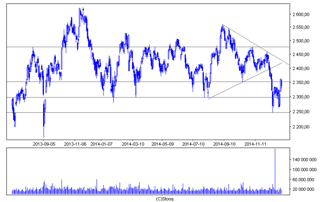
Wykres 1. WIG20 w interwale dziennym.

WIG20 w zeszłym tygodniu mógł zaliczyć całkiem udany powrót powyżej poziomu oporu na 2350 pkt, bowiem sesje środowa i czwartkowa to pokaźne wzrosty na niezłym wolumenie. Jednak w piątek nastąpiła korekta, która spowodowała zamknięcie tygodnia poniżej 2350 pkt. Cały tydzień indeks zalicza jednak do udanych, bowiem zyskał 1,2%. Technicznie jednak wciąż do przebicia pozostaje poziom 2350 pkt, co wydaje się jednak być możliwym. Wówczas to będzie można prognozować test linii krótkoterminowego trendu spadkowego, czyli okolic 2400 pkt. Przebicie tego oporu otworzyłoby natomiast drogę do 2475 pkt. Negatywnie dla byków wyglądałoby złamanie strefy wsparcia 2250-2300 pkt.